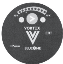
MÓDULO ERT MODULE ERT

Relógio de 24 horas 24 hour clock Incremento menor - 15 minutos Smallest increment - 15 minutes Ajustável através de seletores mecânicos Adjustable using mechanical selectors Operação contínua e funções de desligar permanentemente Continuous operation and permanently shutdown functions Opcional: Versão KT com termóstato anti-calcário (temp. de desligar 55°C/ temp. de ligar 45°C) Optional: KT version with anti-lime thermostat (switch-off temperature 55°C / switch-on temperature 45°C)