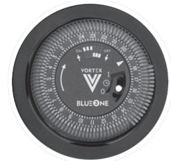
MÓDULO ZM/ ZM TK MODULE ZM/ ZM TK

Relógio de 24 horas 24 hour clock Incremento menor - 30 minutos Smallest increment - 30 minutes Ajustável através dos botões de pressão Adjustable through push buttons Visor de operação Operation display Operação contínua e funções de desligar permanentemente Continuous operation and permanently shutdown functions